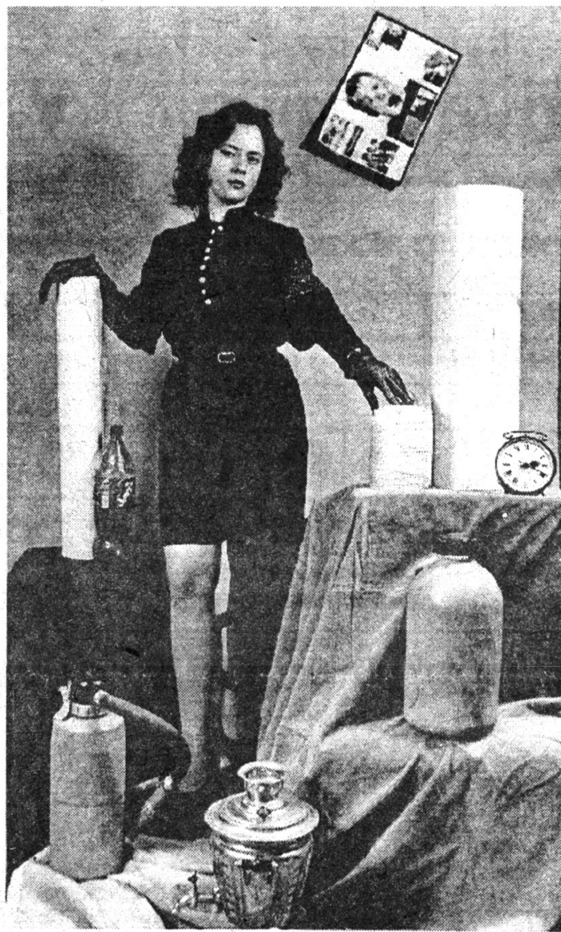
"Портрет с будильником и огнетушителем".